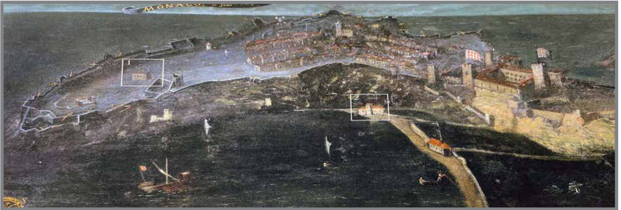
■ Tableau du XVII ème - Eglises 1- Saint Martin 2- Sainte Marie du port