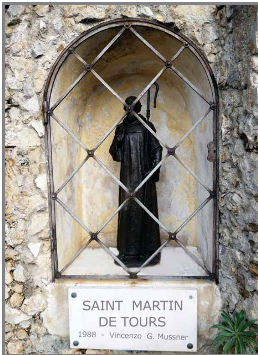
■ Saint Martin de Tours - Chemin du Fort Antoine

Dopu a cunstrüciùn d'a gèija San Niculau, a capela San Martin è stä pocu a pocu abandonä ma, ün 1630 u principu Unuratu II l'ä fä restaurä e a capela è stä turna drüverta a u cültu. L'anü dopu, dürante l'epidemia de pesta che ä esterminau circa dèije per çentu d'a pupülaçiùn munegasca, cun curage, i batü gianchi se sun ucüpai d'i maroti a despetu d'u periculu de cuntaminaçiùn e an assügürau l'ünterru d'i morti ünt'u çementeri d'arrente ä capela. A u mese de mägiu de chël'anü, per a festa d'ë Rugaçiue 3 , a gente s'ë ghe ancura üncaminä ün profescia ma dopu, a capela è stä turna abandonä e pœi, ün 1755, è stä destrüta .