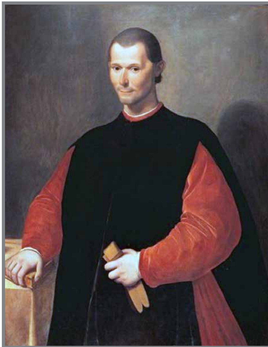
■ Machiavel (1469-1527)

Pocu dopu, ün 1511, tempi de marugi pulitichi, üna nœva garruya è capitá tra a Repùblica de Sciurença e a Signuria de Mùnegu a prupòsitu d'u dritu d'a marina. Dopu l'assedi d'u 1506-1507, de fronte a grande dificürtae finançiare, Mùnegu à reclamau â Repùblica de Sciurença u pagamëntu d'ün veyu dëbitu cuntratau ün 1424. Ma, a Repùblica de Sciurença nun vurëva pagá, alura, vistu u dritu d'a marina che permëtëva a ün creditù d'utegne d' u so suvràn lëtre patente che l'auturizavun a agantá sci'a marina u nulëgiu d'u dëbitù o d'i soi cumpatrioti, Mùnegu s'è ümpadriniu d'üna granda galera tuscana a u largu d'u Cavu Martin, u « San Cristofu ».