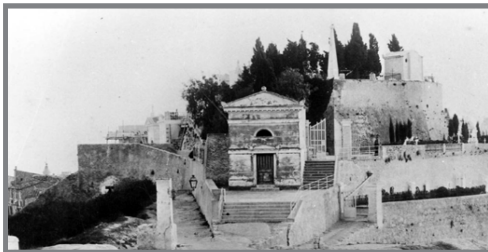
■ Du vieux château au Cimetière (Menton)