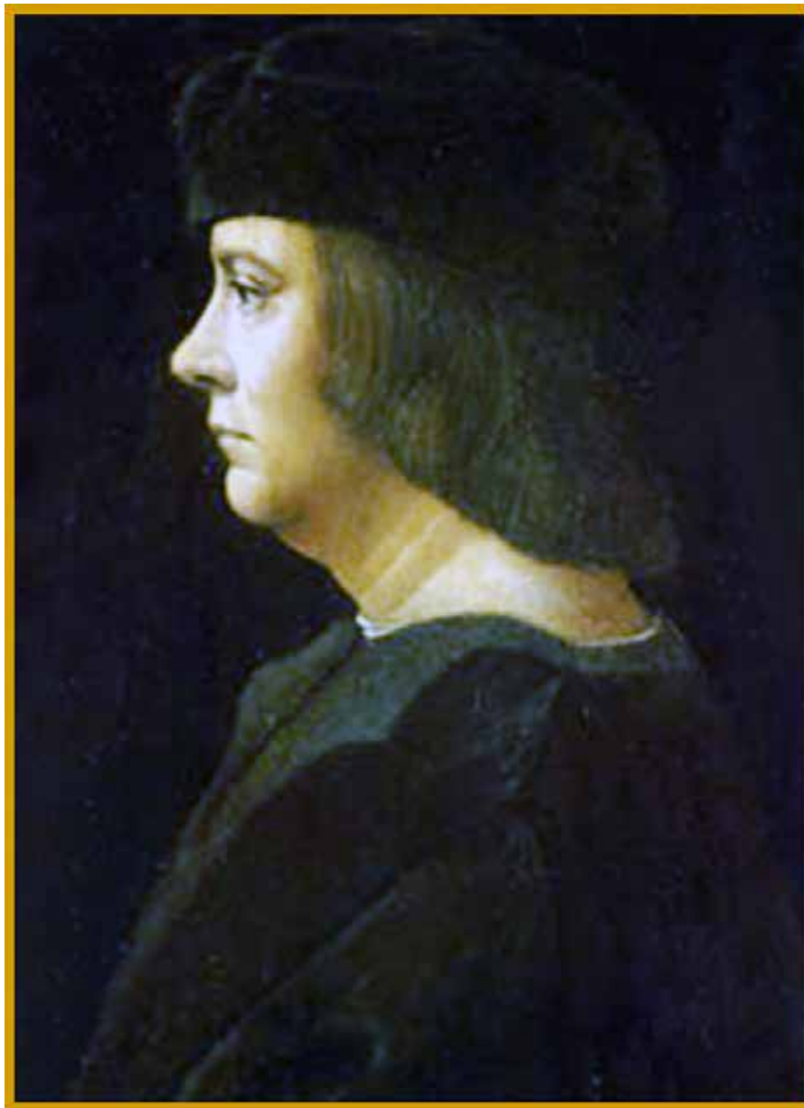
■ Lucien Grimaldi (1481-1523)

Ma è stau ünt'u so castelu de Mentùn, restaurau e ümbeliu ün 1504, che Lucien Grimaldi à reçevüu u so oste e che u patu è stau firmau u 27 de màgiu d'u 1511, patu che stipülava franchise commerciale ünt'i porti de Sciurença e ünt'achèli d'a Signuria de Mùnegu. Achèstu castelu, destrütu per tre vote da ë gherre e a pocu a pocu abandonau, è stau achistau d'a münicipalità de Mentùn u 2 de nuvembre d'u 1807 cun l'idea de ne fà ün çementeri.