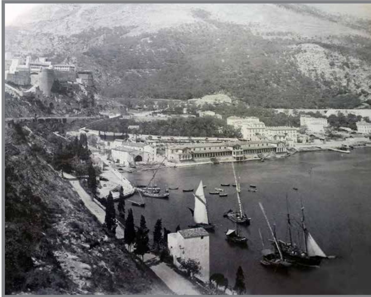
■ La Condamine avec au 1er plan la tour de la Quarantaine - Photo W. Rauch 1868 - Coll C. Burle

Dürante l'epidemia d'a pesta ün 1631, s'é finta pruibia l'ientrà d'i bateli ünt'a rada de Mùnegu a u principale sbarcu sitüau a l'iniçi d'a banchina Antoni Primu che se ciamava alura «A Marina». Sci'a Roca tambèn, tüt'a gente è stà mëssa ün qarantena. Ün lazarëtu è stau stabiliu a u Castelu-Nœvu a levante d'a Roca, ünciü d'a Porta Nœva, unde se trova ancœi a Scœra d'ë Arte Plàstiche – u Pavijùn Bosio.