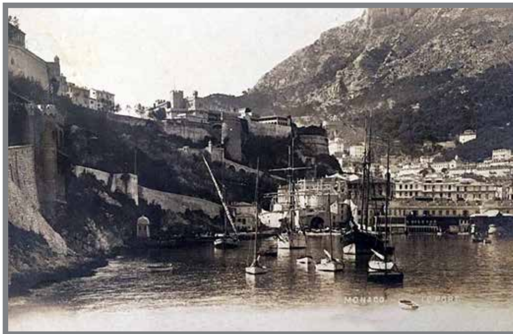
■ Le Port de Monaco et la Tour de la Quarantaine à l'extrême gauche au début du XX e siècle

« Le mal est leste pour venir et lent pour s'en aller ».