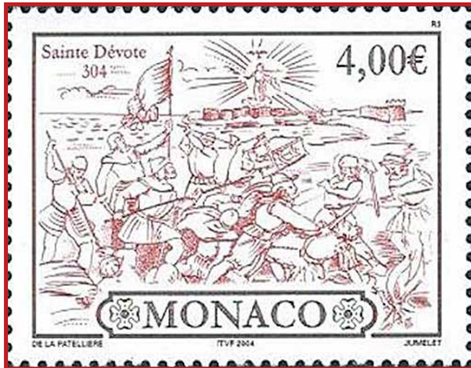
■ Timbre : Apparition de Ste Dévote sur les Remparts assiégés par les Génois

Posez-la sur le feu et après écumage dès les premiers bouillons, retirer et égoutter, mais conservez tièdes les carrés de morue dans une pignate de terre.