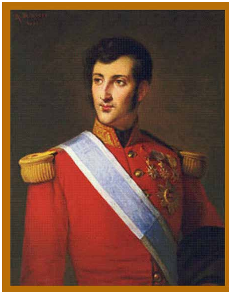
■ Honoré V

Cette rencontre eut lieu sans témoins come le précise le maire de Cannes dans un rapport rédigé le lendemain : « Monseigneur le Prince de Monaco... fut appelé par Napoléon qui le garda jusque vers les quatre heures. La conversation ne fut pas entendue ». Les chroniqueurs de l'époque ne manquèrent pas de combler ce vide en imaginant des dialogues tous plus ou moins fantaisistes. Alexandre Dumas lui-même dans un article paru dans le « Voleur » du 30 juin 1841 relata de manière anecdotique et amusante, voire quelque peu désobligeante cette entrevue. (voir le texte ci-dessous)