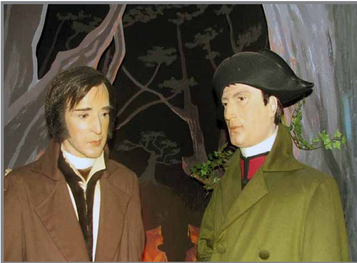
■ Le prince Honoré et Napoléon - Ancien Musée de Cires de Monaco - 27 rue Basse sur le Rocher

D'ün custà, l'Imperatù scadiu à lasciau l'isura d'Elba unde è stau mandau ün esiliu dopu u tratau de Fontainebleau per desbarcà a Gurfu Giuàn u primu de marsu d'u 1815 e cumençà a so' ùrtima e fantàstica aventüra d'i «Çentu giorni». De l'äutru, u Principu ereditari Unuratu Gabriele s'ün-caminandu versu Mùnegu per ientrà ün pussessu d'i soi Stati, è arrivau a Cannes u stëssu giurnu. De fati, So päire Unuratu IV tu tropu marotu per se rende a cantu d'i soi sùditi, gh'avëva dau a delegaçiùn d'u putere suvràn ünt'u Principatu.