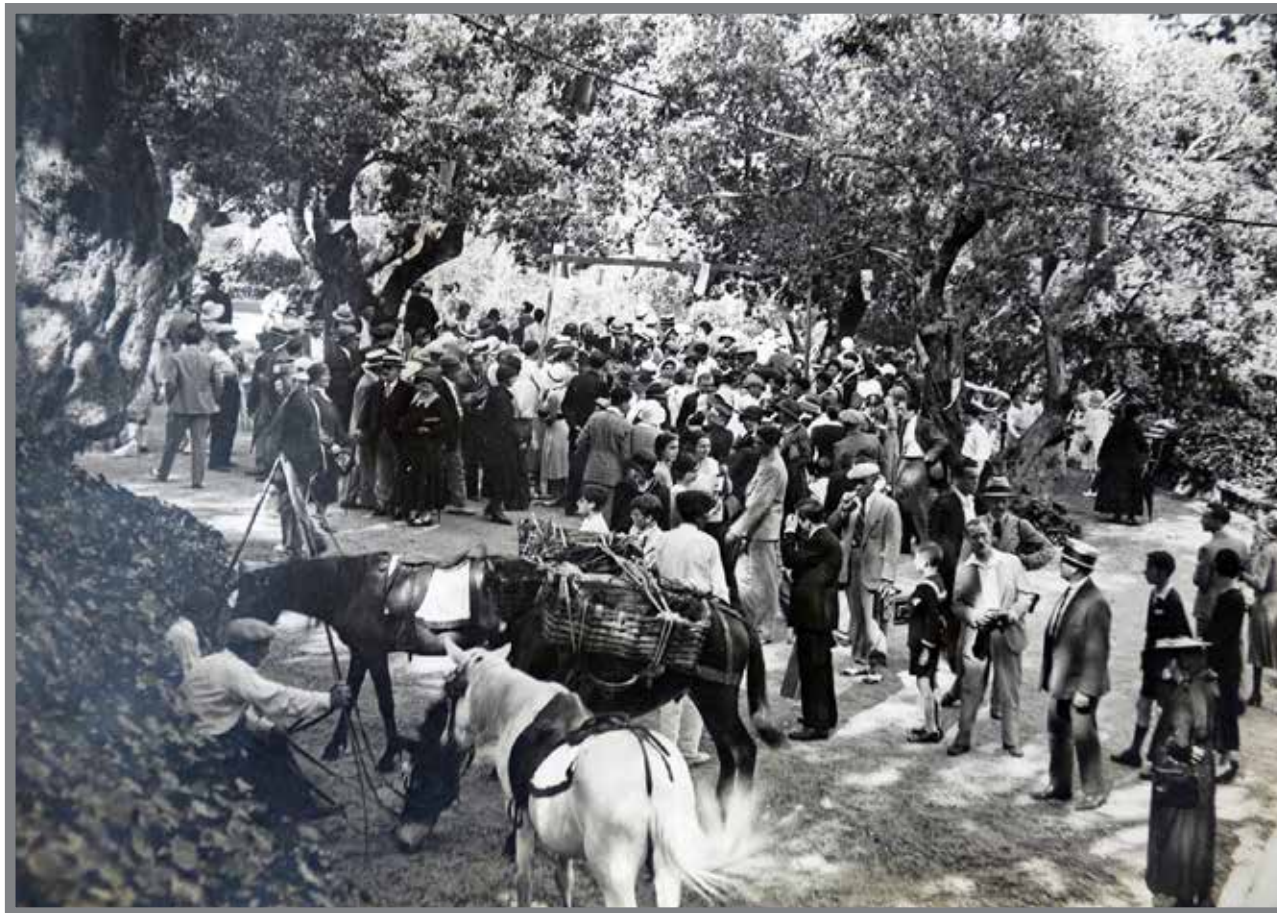
■ Festin monégasque dans le Parc Princesse Antoinette 1931

Per min, è ün unù de zuntà che avèvu prumèssu a u Suvràn de nun destrüje ün sulu árburu d'urante l'ünstalaçion d'u Parcu e che, gràcia tambèn à dediçion d'i mei cari culaburatu, achèsta prumèssa è stà tegnüa darreu. I çentu çinquanta sei árburu de l'aurivètu sun stai cunservai cun prun cüra e a ço d'açi margradu è dificürtae devüe suvra tütü a l'ümpurtanta pendença d'u terrèn.