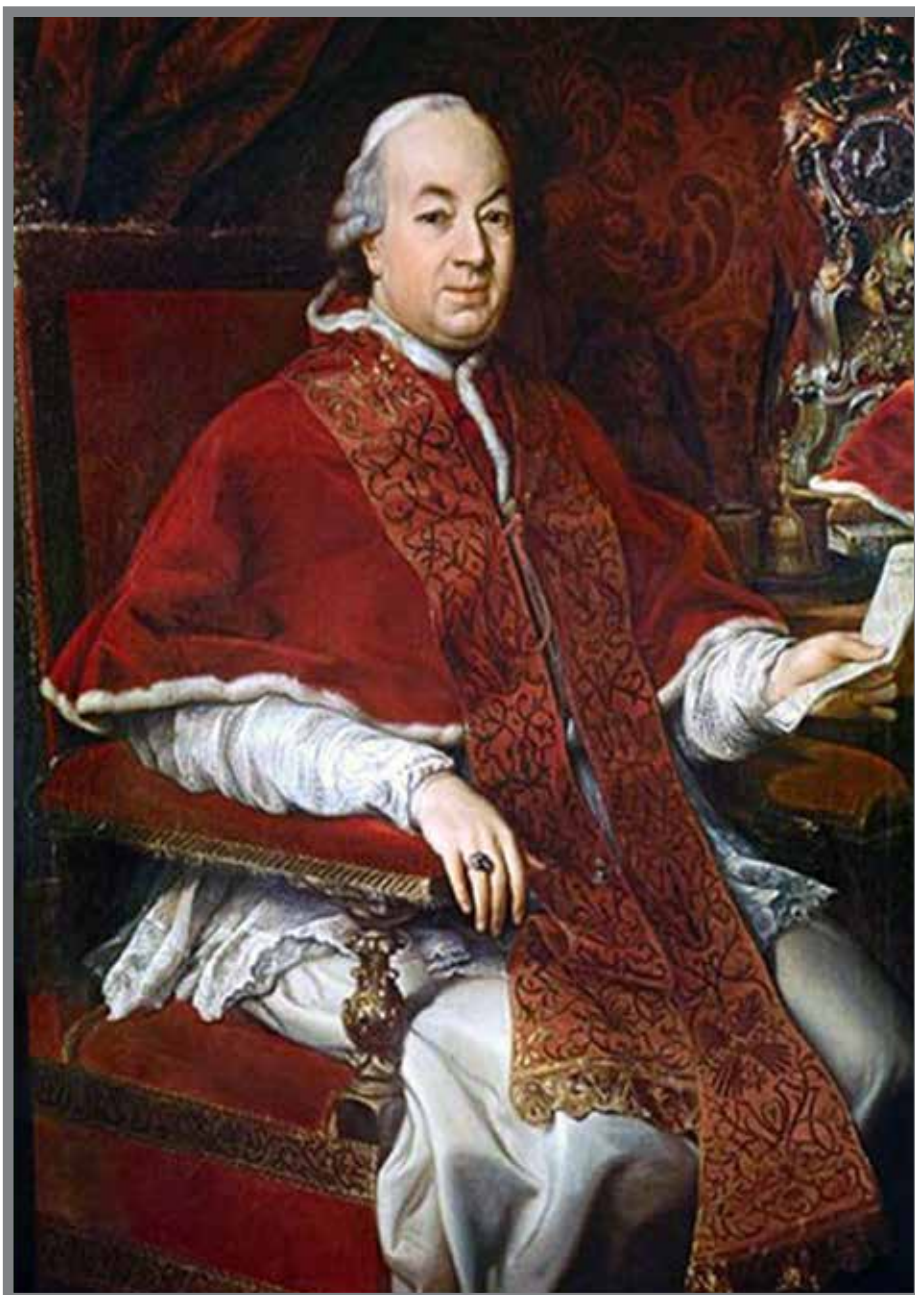
■ Portrait du Pape Pie VI par le peintre italien Pompeo Girolamo Batoni