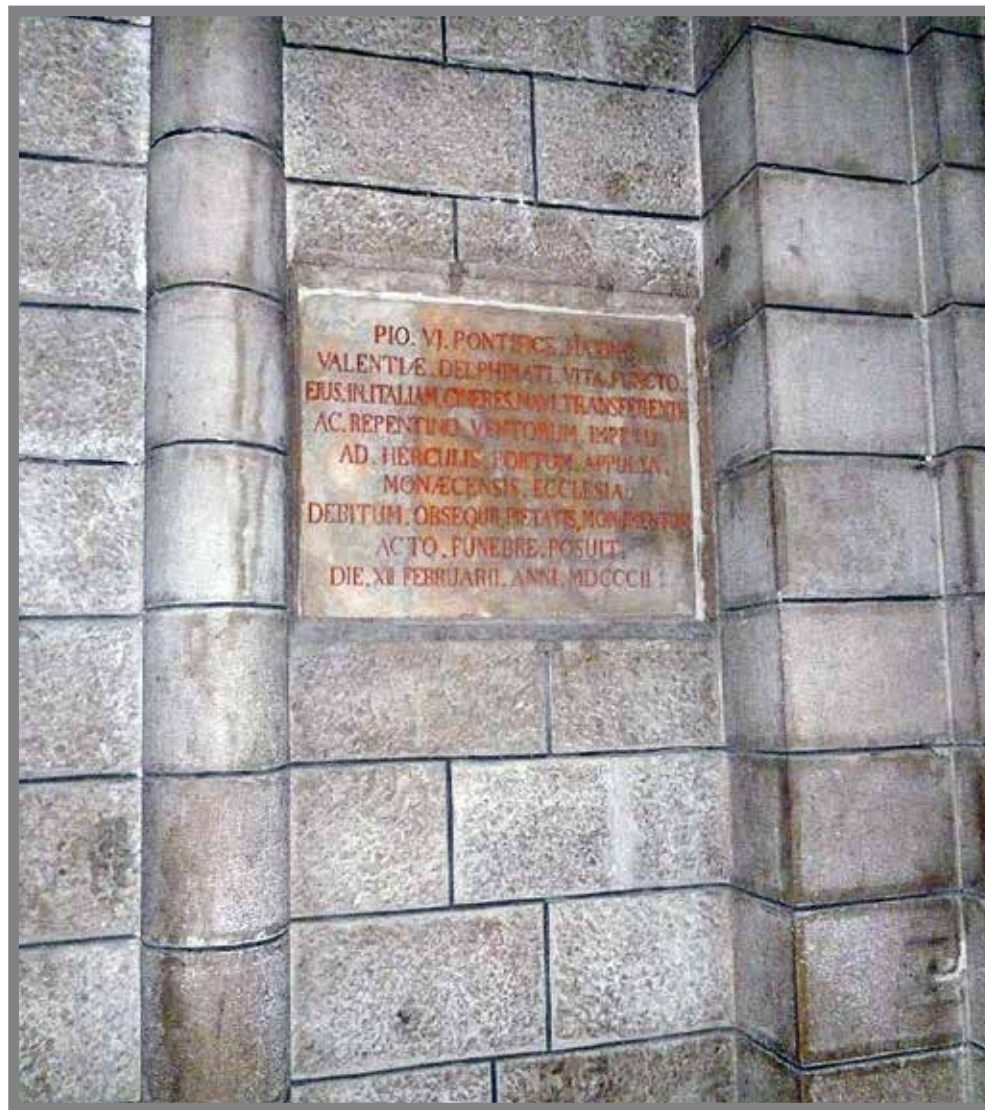
■ Inscription en latin sur une plaque pieusement replacée dans le déambulatoire de la Cathédrale

Da primu, gh'an fau ün ünterrü civile (ürtim' utrage!) ünt'u çementeri de València, ma cun u miyurà d'ë relaçiue tra a Santa-Sede e a Prima Repùblica Françesa e u cuncurdatu, u corpu de Piu VI tu è stau repatriau a Ruma ün 1802 per ghe iesse suterrau ünt'a Basílica San Pietru.