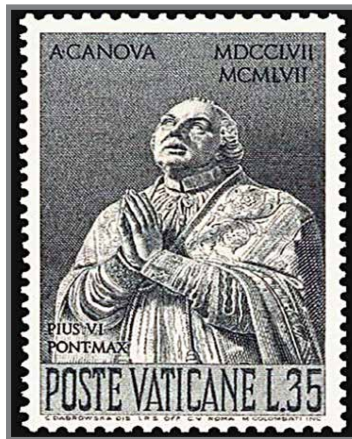
■ Timbre à l'effigie du Pape Pie VI dans le cadre d'un hommage au sculpteur Antonio Canova