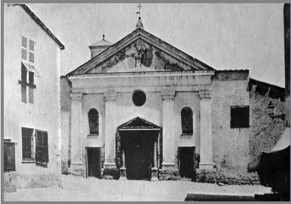
■ L'ancienne église Saint-Nicolas sur le Rocher