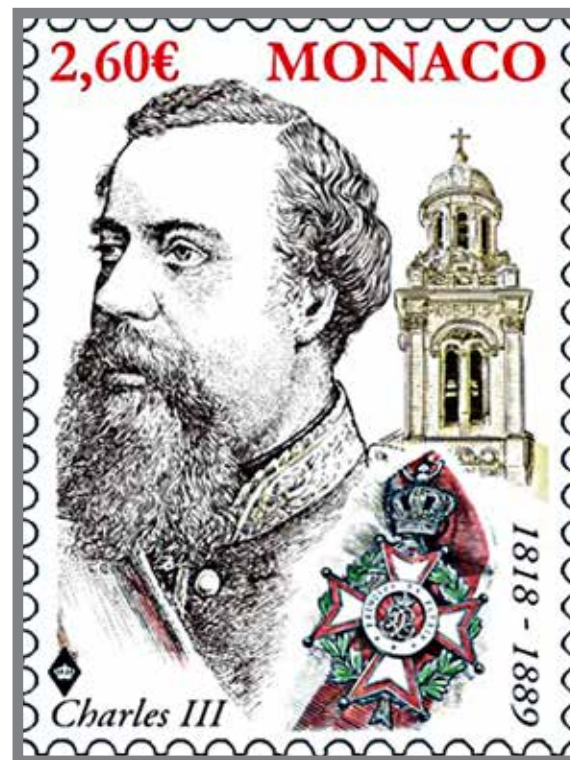
■ Deux timbres à l'effigie du Prince Charles III : le 1er timbre monégasque en 1885 et celui du bicentenaire en 2018

Tout cela est maintenant transformé, grâce à l'intelligente initiative du Prince Charles III... La vieille pointe des Spélugues métamorphosée ne devait point garder sa dénomination ancienne qui rappelait la solitude et la stérilité. A la ville nouvelle il fallait un nom d'un heureux augure et qui fut le gage de sa prospérité future, Monte Carlo !