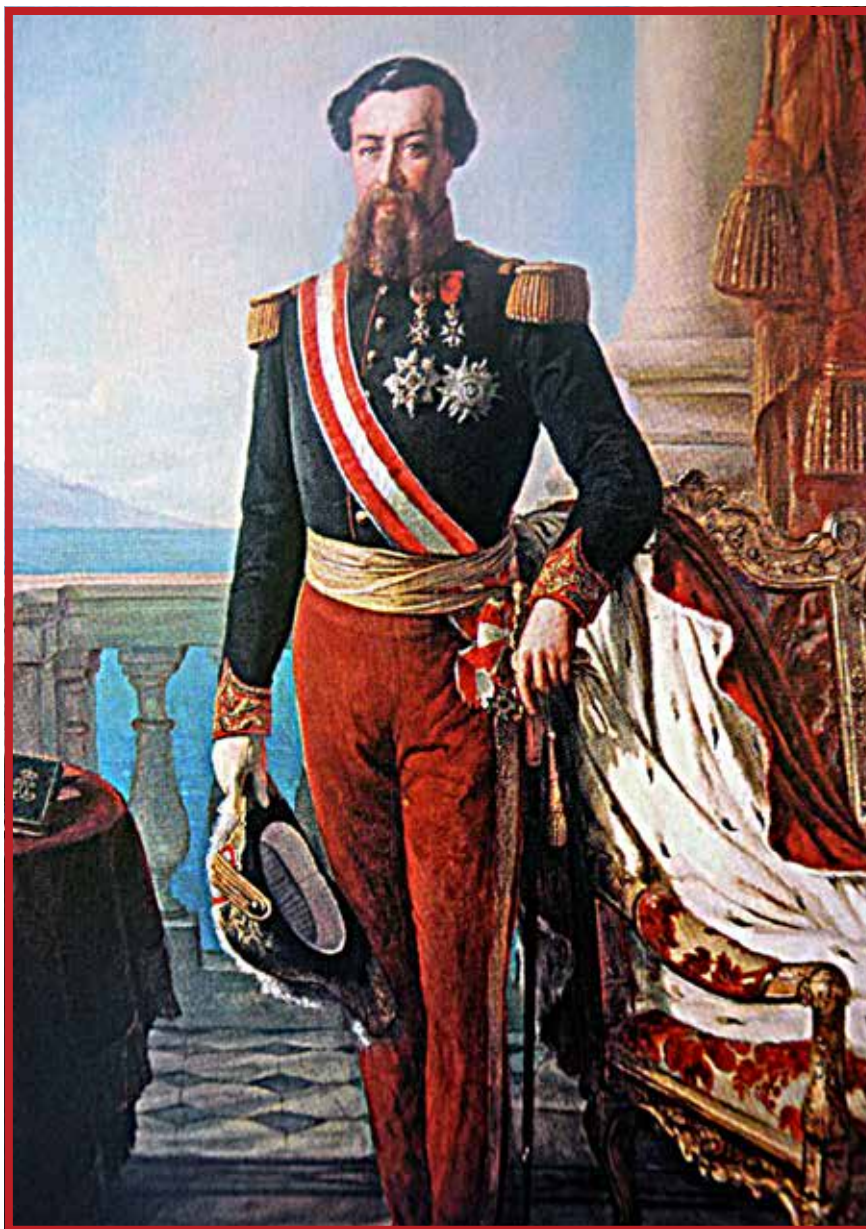
Portrait de Charles III par François-Auguste Biard, (Palais de Monaco)

A So' grand' idea, «a So' briusa idea» è stâ de fâ de Mûnegu üna staçiün da bagnu basâ sci' u divertimentu e u giøegu. Cunsiyau da So' mãire a Principessa Carolina e cun l'agiütü d'ün omu d'affari eceçiunale e ingegnusu, Françaù Blanc, u Principu Carlu III cu â riesciüu a fâ de Mûnegu üna d'ë staçiue turistiche ë ciü rafinae d'Europa. Cun u primu Casin sci' u Platò d'ë Spelüghe, inaugurau u 18 de fevrâ d'u 1863, achëstu qartiè vâ a gh'avè ràpida espansiün e prusperità cina de prumesse. U primu de San Giuane d'u 1866 â piyau u nume de Munte-Carlu, ün umage a u Suvrán.