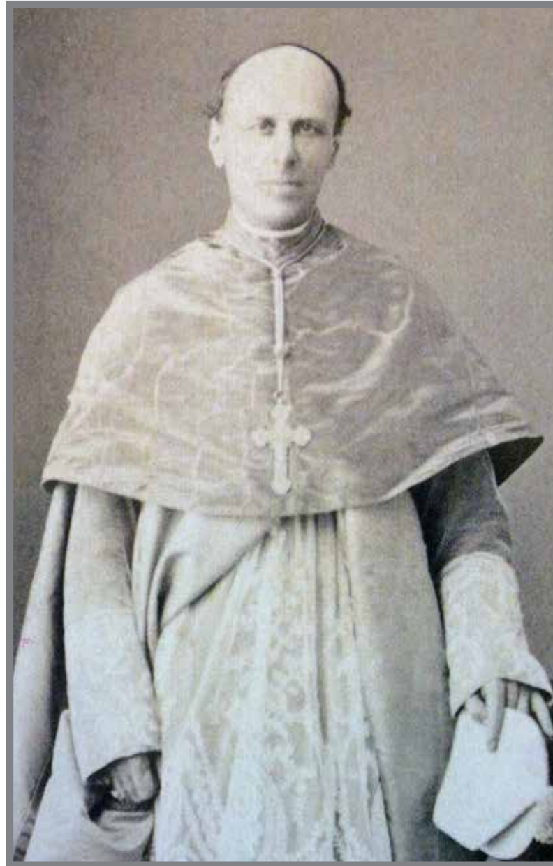
■ Mgr Charles Theuret, premier évêque de Monaco (1887)

Tra tempu a veyà gèija de San Niculau è stà destrüta e a u so postu an cumençau a cunstrüi a Catedrala. A prima pèira è stà pusà u 6 de zenà d'u 1875. Cuscì, Carlu III cu à anticipau l'avegni che cunfermerà ë soe sperançe.