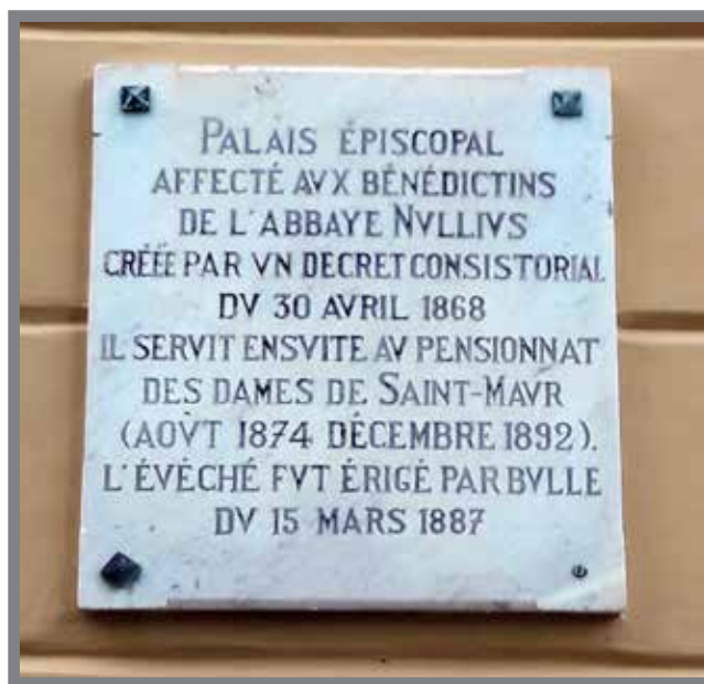
■ Plaque apposée sur la façade de l'Archevêché de Monaco, rue de l'Abbaye sur le Rocher