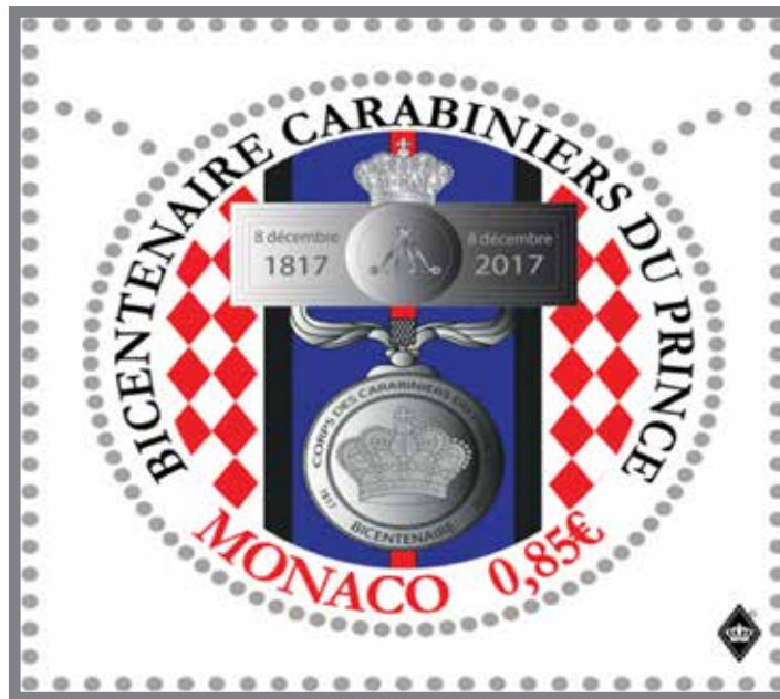
■ Timbre du Bicentenaire

« A Santa Caterina (25 novembre) ë montagne fan farina, ë castagne virun a schina. »