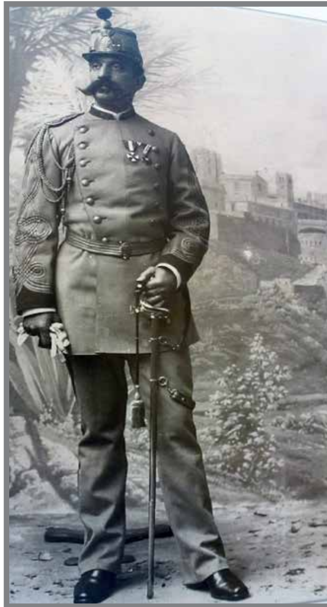
■ Officier des Gardes sous le règne du Prince Charles III

Sa devise est «Honneur–Fidélité–Dévouement». La dernière volonté du prince Rainier III de confier aux carabiniers l'honneur de porter son cercueil (habituellement réservé aux pénitents de la Vénérable Archiconfrérie de la Miséricorde). et plus récemment la nomination dans l'Ordre des Grimaldi, par S.A.S Le Prince Souverain Albert II, de l'Orchestre de la Compagnie des Carabiniers, à l'occasion de son cinquantième anniversaire, en récompense de sa contribution au prestige et au rayonnement de la Principauté, témoignent de l'attachement profond des Princes de Monaco envers ses carabiniers.