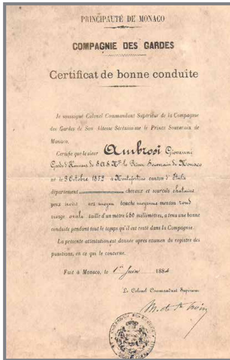
■ Certificat de bonne conduite d'un «Papalìn»

I Carrabiniei d'u Prìncipu an l'üncargu d'assügürà a gàrdia d'u Palaçi e de stà atenti â sügürità d' a So' Altessa Serenissima u Prìncipu Suvràn e d'a So' Famiya ma tambèn de l'esecütà d'è lege e de participà a u mantegnimèntu de l'ürdine pùblicu. Ancœi, a Cumpagnia è cumpusà de trei ufiçiali, düjanœve suta-ufiçiali e nuranta sete surdati.