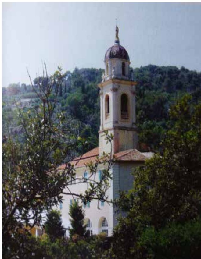
Sanctuaire de Laghet